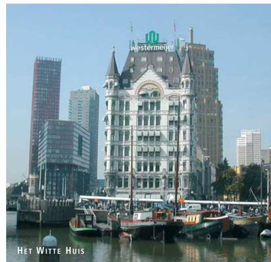
HET WITTE HUIS

Oude Haven-district met zijn tientallen (verwarmde) terrassen en het Witte Huis (anno 1898), dat een tijdlang het hoogste kantoorgebouw van Europa is geweest. Hier is ook het Mariniersmuseum. Over de geschiedenis van het Witte Huis en de mariniers in een volgend nummer meer.