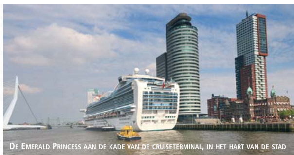
DE EMERALD PRINCESS AAN DE KADE VAN DE CRUISE TERMINAL, IN HET HART VAN DE STAD