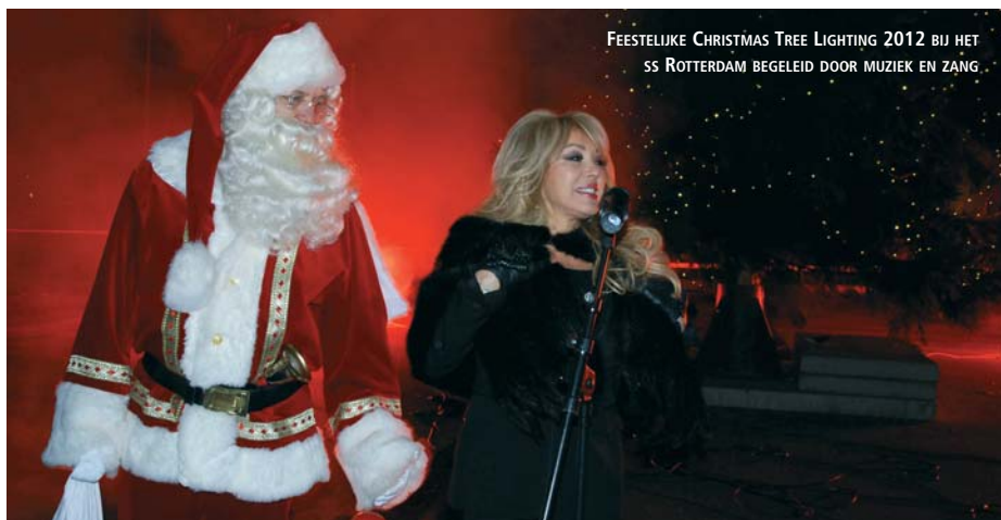
FEESTELIJKE CHRISTMAS TREE LIGHTING 2012 BIJ HET SS ROTTERDAM BEGELEID DOOR MUZIEK EN ZANG.

3 januari tot 8 januari de Zesdaagse van Rotterdam, het Indoor-wielerspektakel in Ahoy. 23 januari start voor de 42e keer het International Film Festival Rotterdam met meer dan 2.700 nationale en internationale filmprofessionals. 7 februari 2013 tot 10 februari 2013 is er " Art Rotterdam " in de Cruise Terminal,