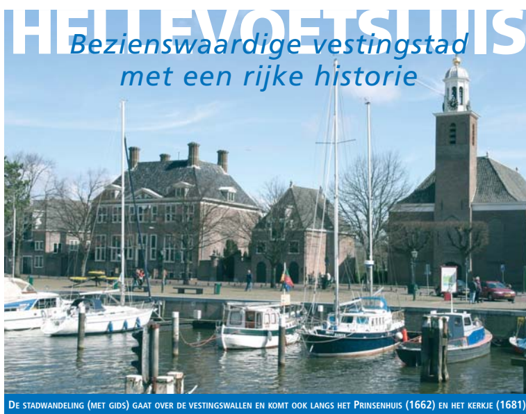
DE STADWANDELING (MET GIDS) GAAT OVER DE VESTINGSWALLEN EN KOMT OOK LANGS HET PRINSENHUIS (1662) EN HET KERKJE (1681).

In 1688 zag de Hollandse stadhouder Willem III tijdens de voorbereidingen van zijn overtocht naar Engeland (om daar koning te worden), ook dat de haven van Hellevoetsluis een bui-